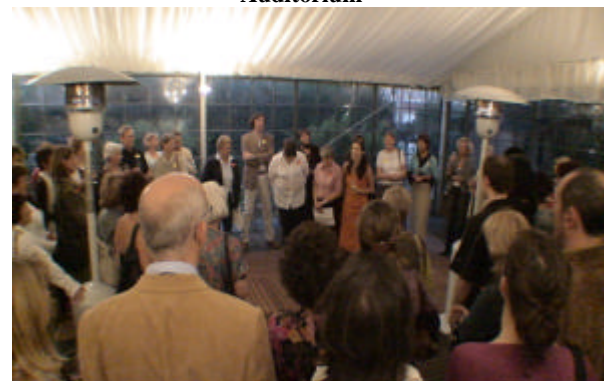
Rezeption am Abend – Empfang unter dem Festzelt