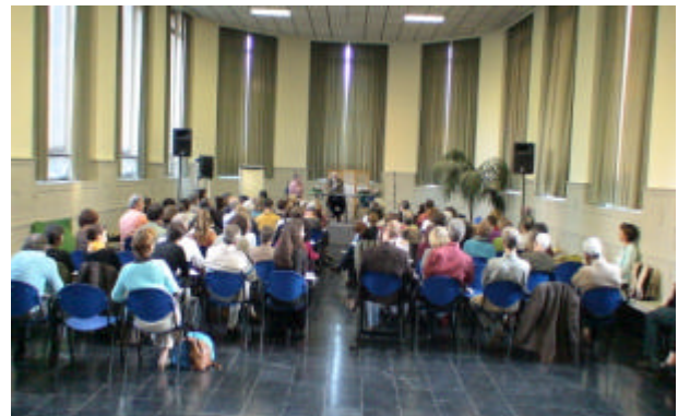
Der Konferenzraum am Sonntag morgen mit dem Auditorium“