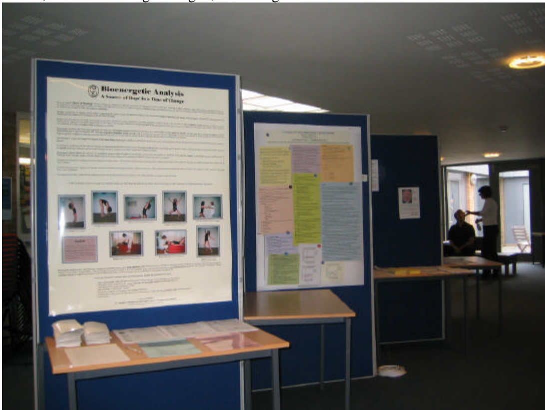
Poster und Dokumente über die Bioenergetische Analyse ausgestellt in der Kongresshalle