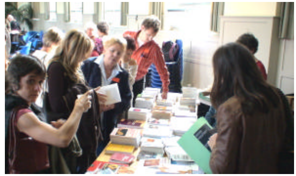
Interesse am Büchertisch in den Pausen