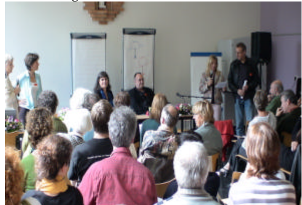
Vorstellung der Arbeitsgruppen