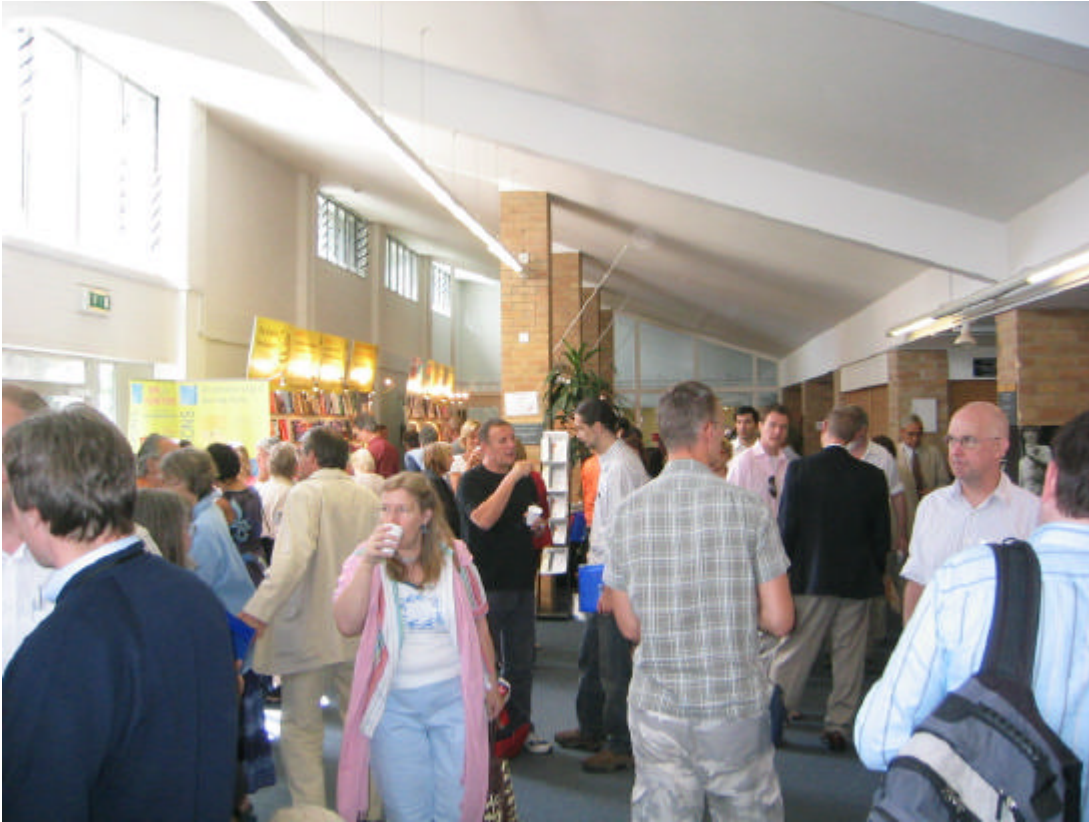
Teilnehmer des Kongresses während einer Kaffeepause