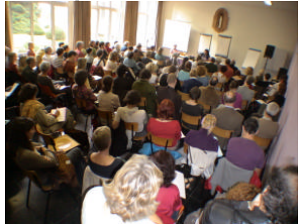
Zuhörer am Samstag morgen während des Vortrags

einige bauen ein Haus: Alle haben die Herausforderung angenommen, einzupacken und auszupacken, neben all dem anderen Stress. Einige Sachen schauen wir uns an, gewichten und wägen sie ab... Und der Rest unseres Lebens geht seinen gewohnten Gang... Es ist eine Frage der Identität oder der Prioritäten. Dieser Wind für Veränderungen steckt an. In mehreren Bereichen kann man ihn entdecken, angefangen vom inneren Leben in der SOBAB bis zur belgischen Gesundheitspolitik.