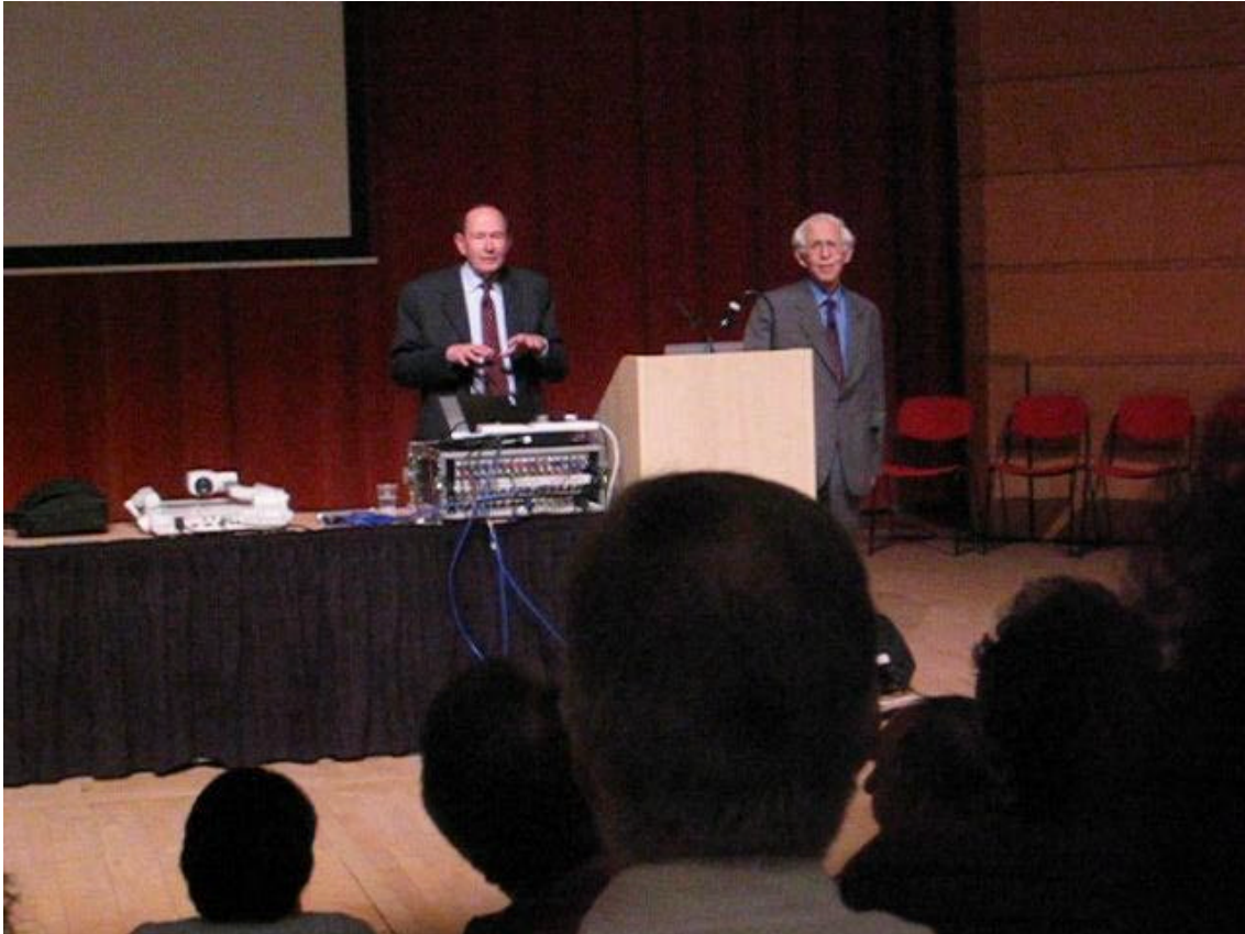
Nobelpreisgewinner Gerald Edelman (links), der von einem Nobelpreisgewinner der Universität Cambridge vorgestellt wird

Das Thema des Kongresses war: "Tage der Erschütterung: Psychotherapie in Zeiten des Wandels". Das war ein sehr gut organisierter Kongress mit interessanten Rednern. Einer von ihnen war der Nobelpreisträger Gerald Edelman, der wiederum von einem Nobelpreisträger der Universität Cambridge eingeführt wurde. Ich denke, dass dieses Ereignis die Anerkennung der EAP als eine seriöse Vertretung der Psychotherapie in Europa fördert. Unglücklicherweise fanden die EAP Treffen manchmal parallel zu den Kongressaktivitäten statt, und ich konnte deshalb nur einen Teil von ihnen besuchen.