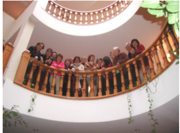
Les participants de l'AG pendant une pause café

rencontre des membres devait se faire, était magnifique, mais, le froid est devenu glacial et la première neige est tombée. Néanmoins l'humeur parmi les délégués était cordiale, il y avait beaucoup à parler, à demander et à rire.