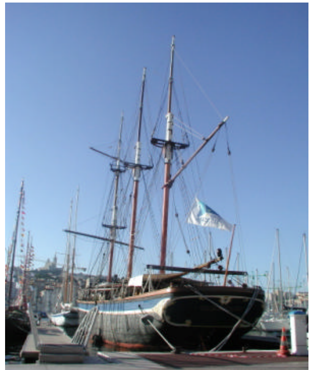
Le fameux voilier "Le Marseillois" au port de Marseille le lieu de la conférence