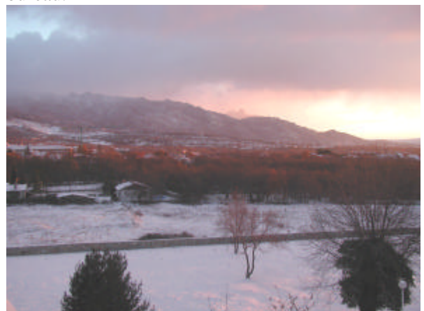
Becerril de la Sierra.