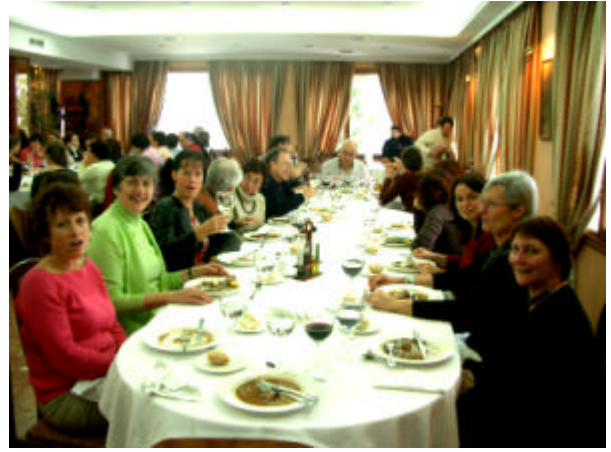
Le dîner du samedi soir à "La Garcelas Hotel"