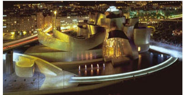
Le musée Guggenheim de BILBAO

A la fin du mois janvier dernier, organisées à Bilbao par la Société du Pays Basque, les Sociétés Ibériques (ACAB de la Catalogne, APAB du Portugal, EHABE du Pays Basque, SAAB de l'Andalousie et SOMAB de Madrid), ont tenu les troisièmes Journées Cliniques, sur le thème " 50 ans d'Analyse Bioénergétique. Corps, Sensation, Emotion ;Relation " Un sujet assez large, comme est-elle large la variété clinique de l'Analyse Bioénergétique dans son actualité.