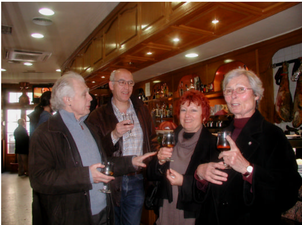
“EC members of EFBA-P relaxing after an EC meeting 2008