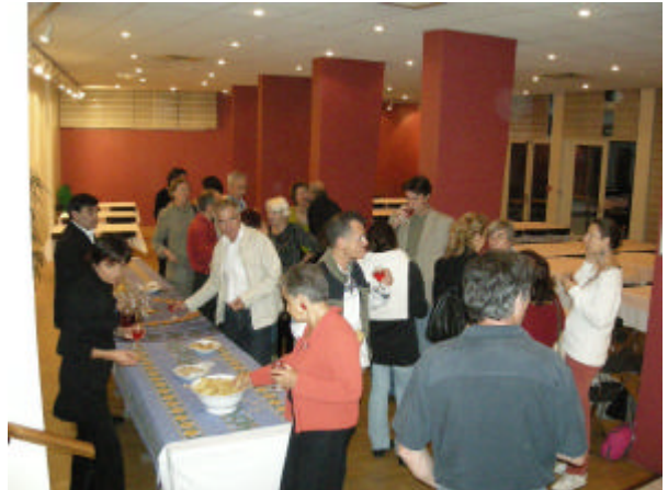
Participants in Paris during the French-Speaking Days 2007

Plusieurs conférenciers venant des différentes sociétés francophones, mais venant aussi d'autres courants analytiques et psychothérapeutiques ont planché sur ce thème dense et nous ont fait partager leurs recherches et leurs expériences cliniques.