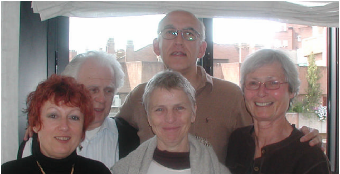
EC members 2007-2008 during an EC meeting in April 2008)