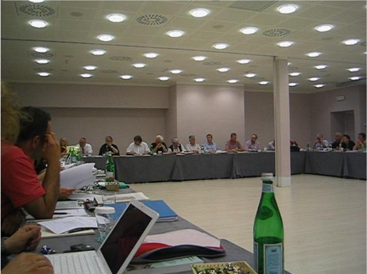
Réunion du Comité d'Administration de l'EAP 2007 à Tirane (Albanie)

L'EAP est une organisation complexe, ses procédures le sont également. Les différentes façons d'obtenir le CEP (Certificat Européen de Psychothérapie) sont en train d'être un peu plus définies. Une « troisième façon » est précisée en plus de celle du « grand parentage » (le cas de tous les CEP accordés jusqu'à présent). Les EAPTIs « European Accredited Psychotherapy Institutes » : les Instituts de Psychothérapie Européens Accrédités (la façon supposée de procéder dans le futur). La « troisième façon » tracera la manière d'obtenir le CEP par les personnes qui font leur formation dans un Institut de Formation reconnu par le EWAO et la NAO locale mais cela ne veut pas dire avoir à s'engager dans la procédure lourde et chère de se faire accepter en tant que EAPTI. Ceci est la situation qui le plus probablement s'appliquera aux personnes formées en Analyse Bioénergétique. La prochaine rencontre à Vienne en Février 2008 sera, à ce sujet, très importante car les propositions le concernant seront discutées et des décisions prises.