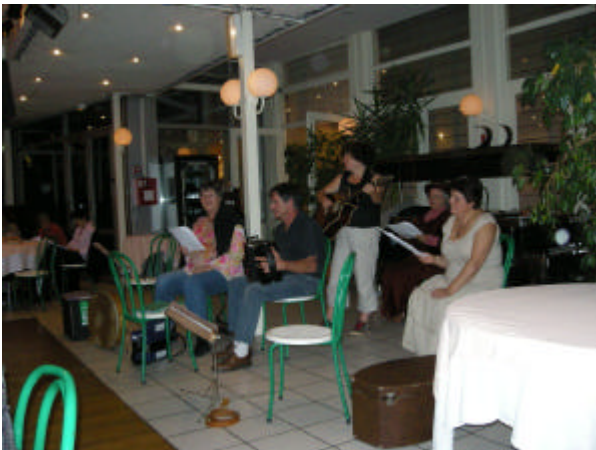
Entertainment on Saturday night