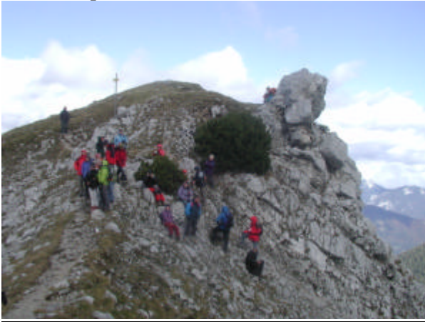
Les „montagnardes“ sur l'arête

Notre seconde conférence a eu lieu à la fin du mois de septembre en Autriche.