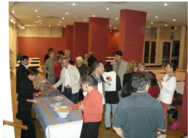
Participants in Paris during the French-Speaking Days 2007