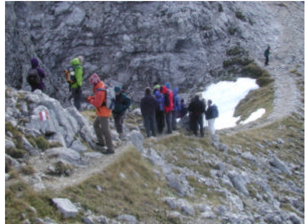
Les participants de l'atelier sur l'arête

approche de l'arête et également l'opportunité de montrer notre travail avec des analogies dans la nature.