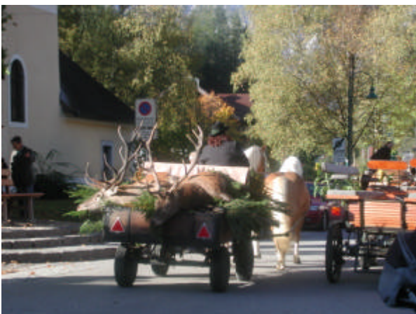
Local traditional Thanksgivingday 2007 in Hinterstoder (on the same day as the conference)