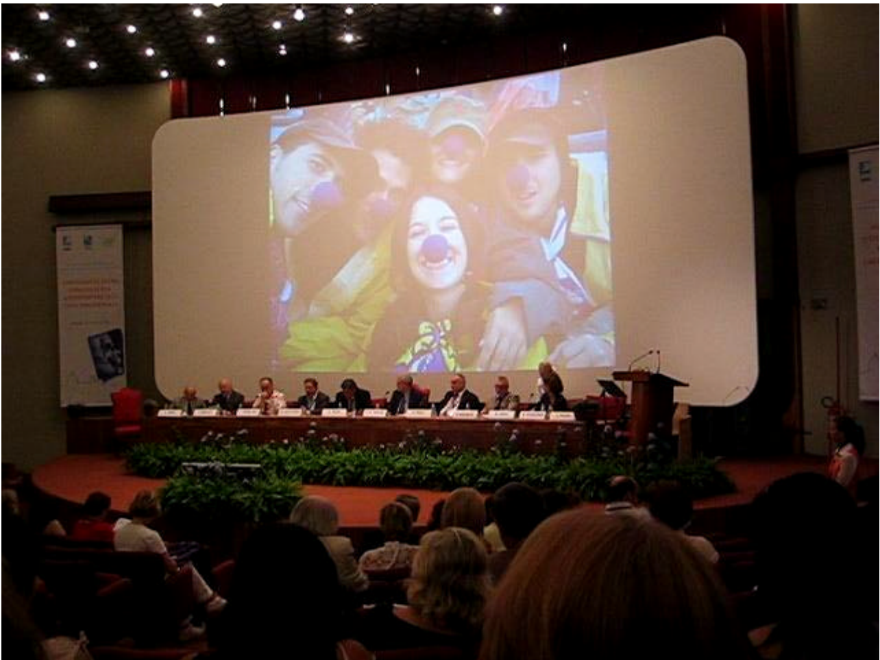
EAP Conférence à Florence Firenze (Italie)