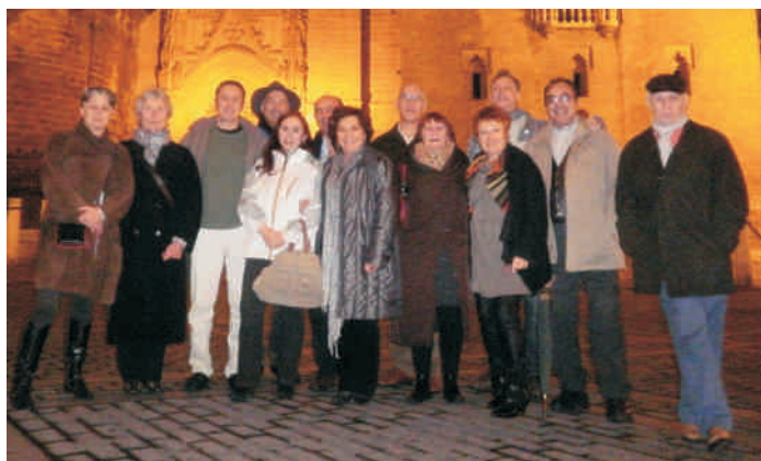
Les Délégués de l'Assemblée Générale

Une discussion se poursuit à ce sujet. Est-ce que ce remboursement va mettre l'EFBA-P dans une position de dépendance ? Est ce que l'IIBA devrait être une fédération de fédérations ? Nous réalisons à quel point cette question est complexe. Nous convenons que les délégués doivent apporter cette question à leurs sociétés afin qu'elle y soit discutée.